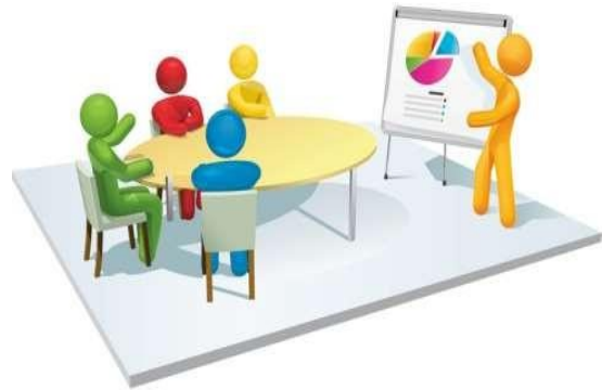
Şekil 2 : Durum Analizi