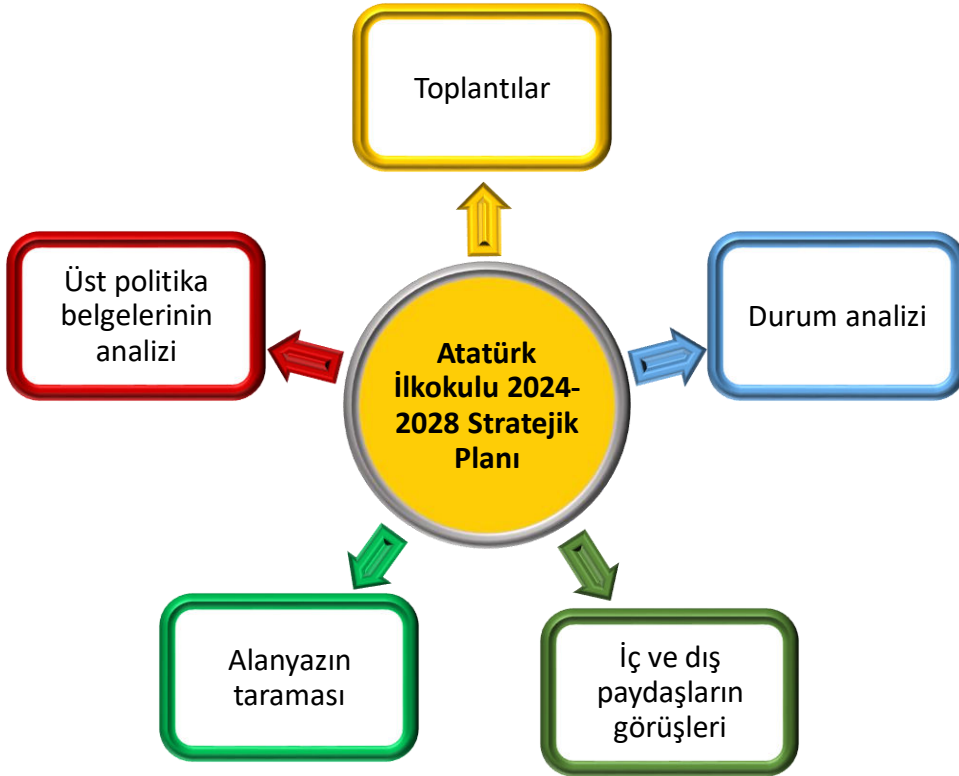
Şekil 1 : Stratejik Plan Oluşum Şeması

2024-2028 dönemi stratejik plan hazırlanma süreci Strateji Geliştirme Kurulu ve Stratejik Plan Ekibi'nin oluşturulması ile başlamıştır. Ekip tarafından oluşturulan çalışma takvimi kapsamında ilk aşamada durum analizi çalışmaları yapılmış ve durum analizi aşamasında, paydaşlarımızın plan sürecine aktif katılımını sağlamak üzere paydaş anketi, toplantı ve görüşmeler yapılmıştır. Durum analizinin ardından geleceğe yönelim bölümüne geçilerek okulumuzun/kurumumuzun amaç, hedef, gösterge ve stratejileri belirlenmiştir.